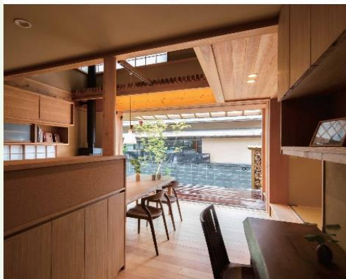
静岡県森林組合連合会